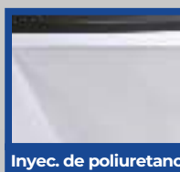
Inyec. de poliuretano