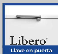
Llave en puerta